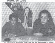
La alternativa feminista, más allá de las elecciones...

★ CHARLA-COLOQUIO CON MILITANTES DE LA A.G.M. EN LUME